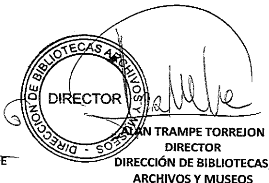
ALAN TRAMPE TORREJON DIRECTOR DIRECCIÓN DE BIBLIOTECAS, ARCHIVOS Y MUSEOS