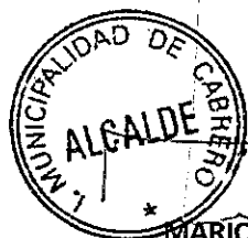
MARIO GIERKE QUEVEDO ALCALDE ILUSTRE MUNICIPALIDAD DE CABRERO

Cualquier incumplimiento a esta cláusula será considerado un incumplimiento al convenio con el PMI en sí mismo, con las sanciones que sus bases ameriten.